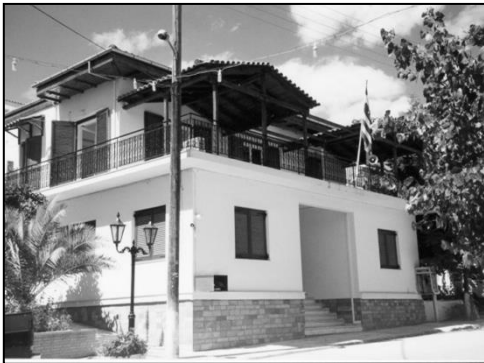
Το Δημαρχείο Πελασγίας, Φθιώτιδος

Η πρώτη διοικητική διαίρεση της Ελλάδας έλαβε χώρα στις 3 Απριλίου του 1833. Η χώρα διαιρέθηκε σε δέκα νομούς οι οποίοι διαιρέθηκαν σε 42 επαρχίες. Οι επαρχίες αυτές διαιρέθηκαν σε δήμους. Με την πάροδο του χρόνου η διοικητική δομή της χώρας υπέστη πολλές αλλαγές. Οι πιο σημαντικές αλλαγές έγιναν το 1912, όταν δημιουργήθηκαν οι Κοινότητες, και το 1999, όταν εφαρμόστηκε το σχέδιο «Ιωάννης Καποδίστριας» κατά το οποίο καταργήθηκαν οι Κοινότητες.